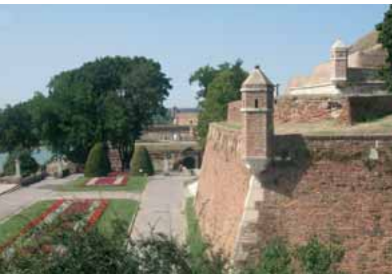
Twierdza w Belgradzie

Idąc prosto (tudzież prawo) ulicą Kneza Mihaila dochodzi się do Kalemegdan – twierdzy otoczonej rozległym parkiem.